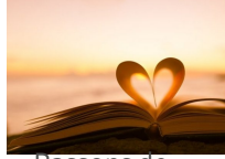
Passons de l'oreille au cœur