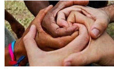
Répondons avec le cœur