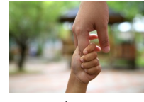
Dieu se donne, nous donnons-nous

Il est recommandé que la prière soit guidée par un parent ou un grand enfant.