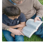
Écoutons la parole